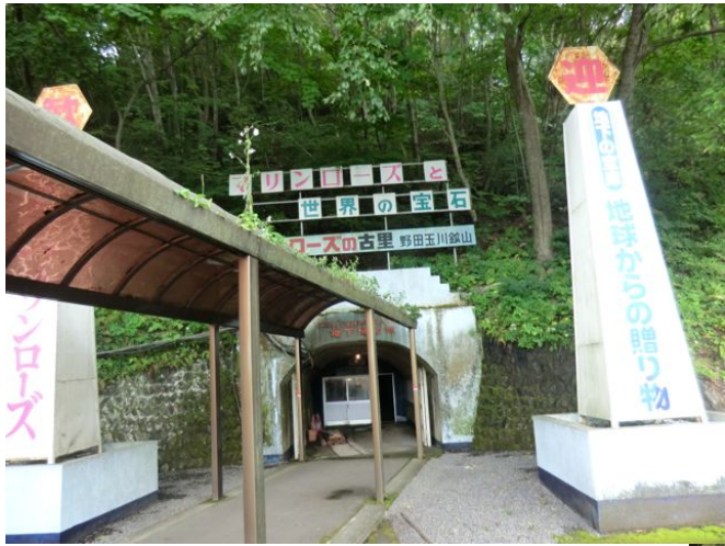
野田玉川鉱山入り口