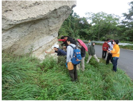
十和田火山噴出物